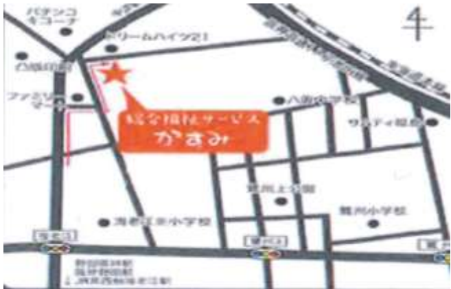
野田阪神駅より徒歩10分