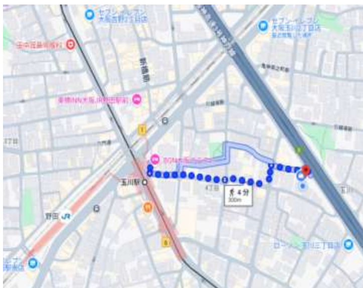
地下鉄玉川駅より徒歩4分